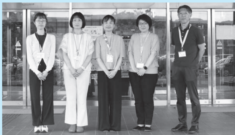
▲保険年金課、健康推進課の皆さん

す。BIWATEKUアプリの積極的な活用に加えて、河川や企画といった市の街づくりのプロジェクトチームに関連部署の一つとして健康部門の職員や保健師も参画し、街づくりの段階から健康づくりの視点を入れるような形で進めています。今後、自然に健康になれる環境づくりが進んでいけばいいと思っています。