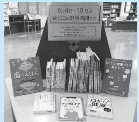
▲図書館連動特集による啓発