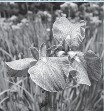
【青島写真：11月上旬の三上田】

野洲市は、歴史と自然が調和した、琵琶湖のほとりに位置する街で、歴史、自然、食、文化、そして利便性の高い交通アクセスなど多くの魅力が詰まった、住み心地の良い街です。 また、古代からの歴史を感じられる史跡や、豊かな自然を楽しめる公園があり、琵琶湖の恵みを受けた新鮮な魚介類や農産物が味わえます。教育機関や文化施設も充実していて、若い世代も楽しめる街です。交通の便も良く、大阪や京都へのアクセスも便利です。