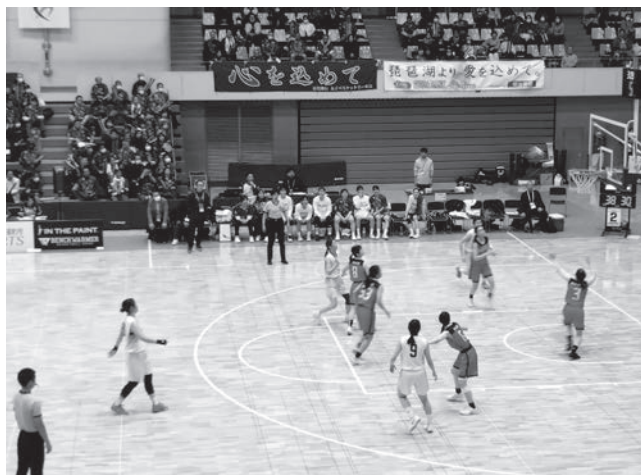
▲国スポ・障スポリハーサル大会の様子