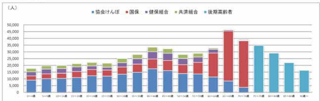
図2 年齢階層別 被保険者数（女性）