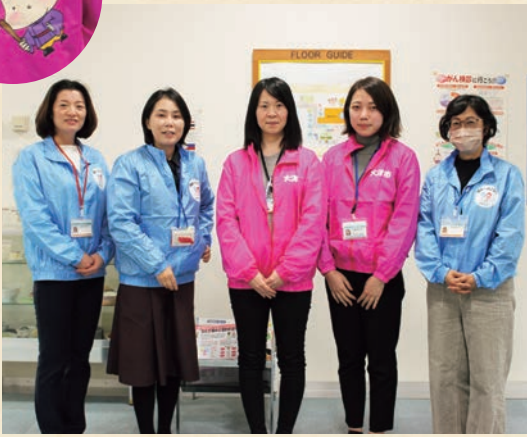
▲健康推進課のみなさん