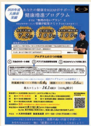
▲健康増進プログラムのチラシ

若年層のメタボ改善を目的とした、全8回3か月間の健康増進プログラム(教室)です。特定健診の結果、BMI25以上となった40歳〜64歳を対象としています。定員は20名、参加費は無料です。プログラムの運営は、公募型プロポーザルで決定したRIZAP株式会社に委託。食事と運動、生活習慣を見直す内容になっています。教室でそれぞれの座学や運動の実習を行い、自宅で実践、定着化につなげるのが狙いです。毎食の食事内容を写真に撮り、専用アプリを通じてトレーナーに報告したり、グループを作って目標を共有し、競い合ったりすることで継続を支援する仕組みになっています。